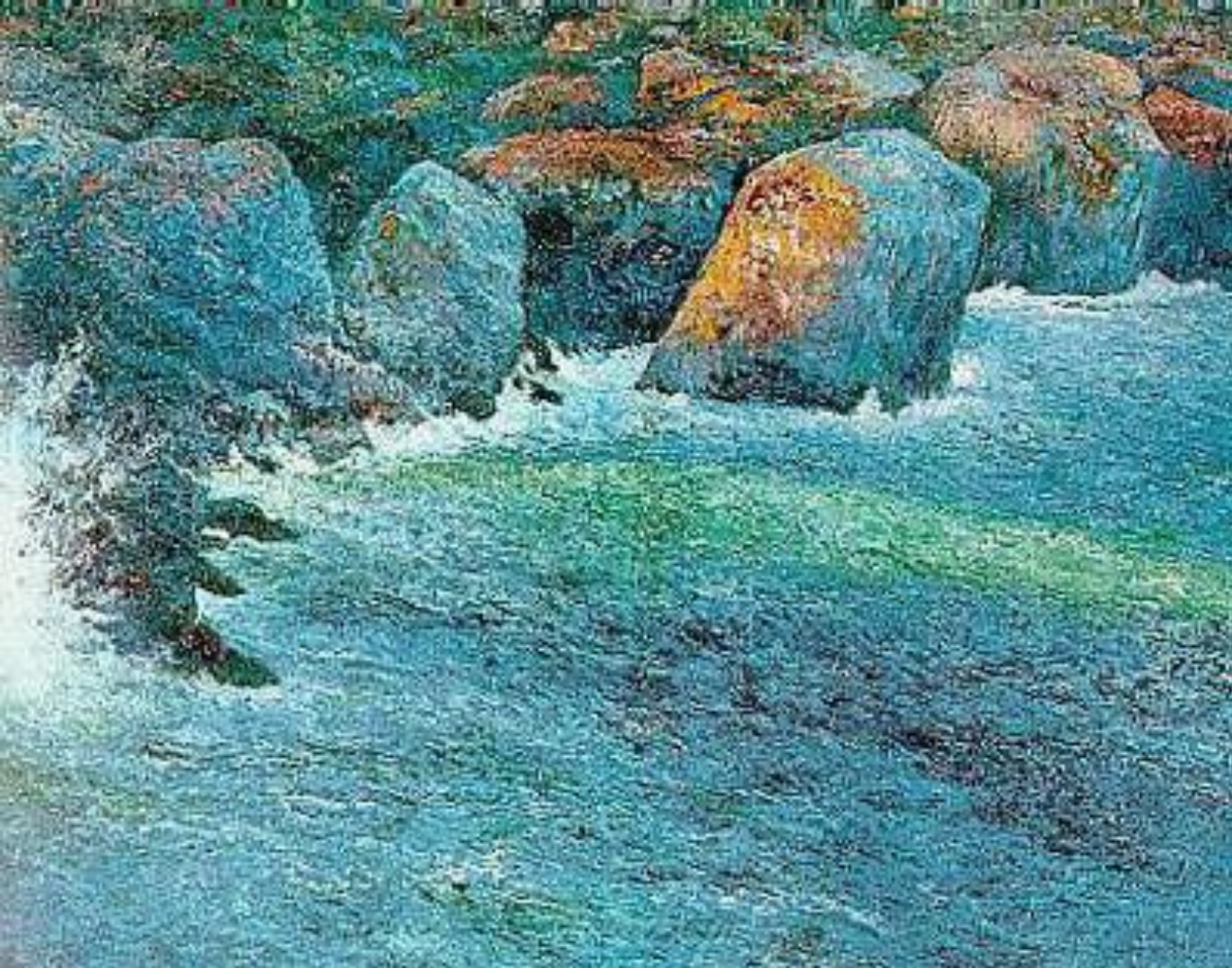
Rocas en el Mar Joaquín Clausell