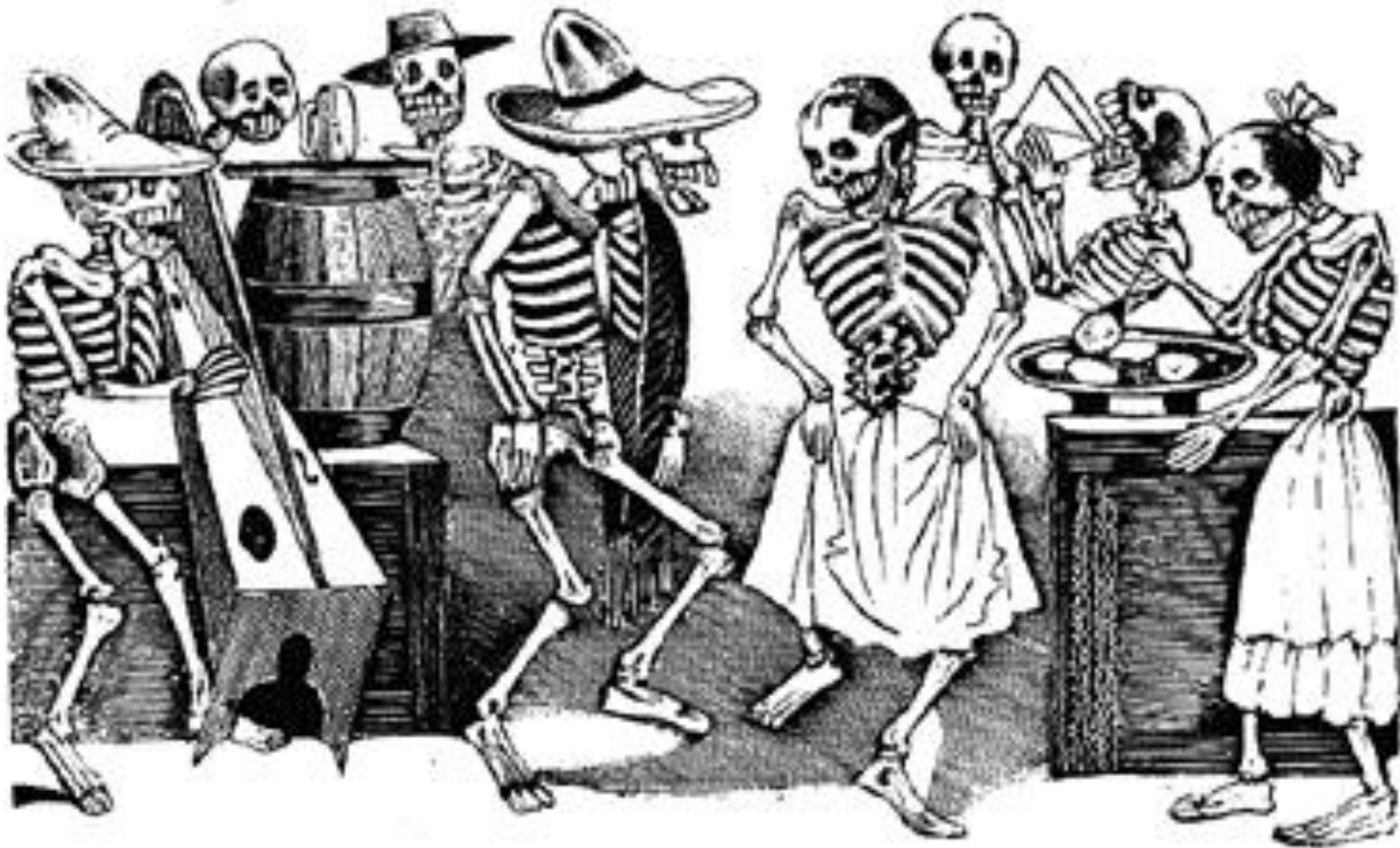
Jarabe de Ultratumba José Guadalupe Posada