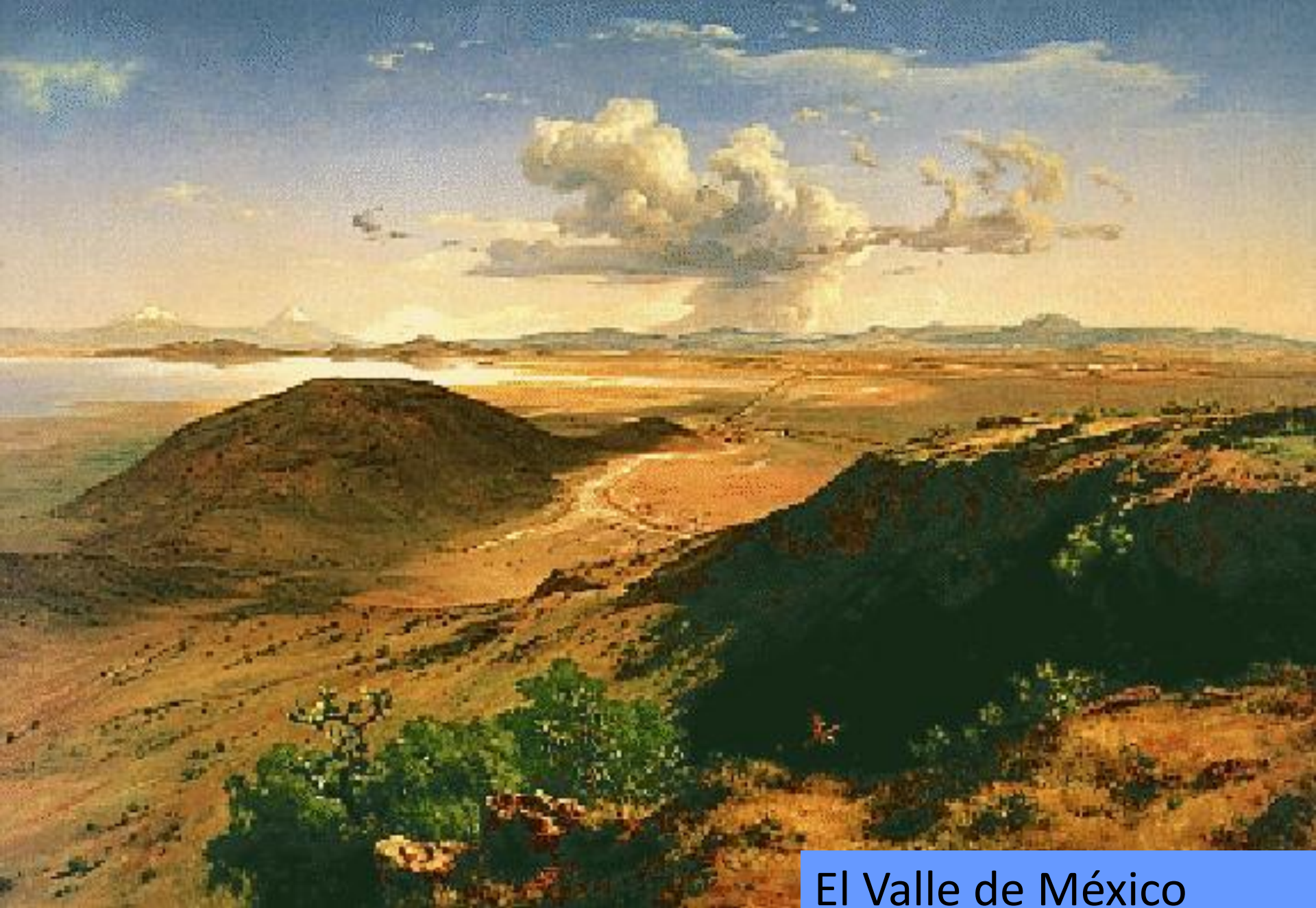
El Valle de México José María Velasco