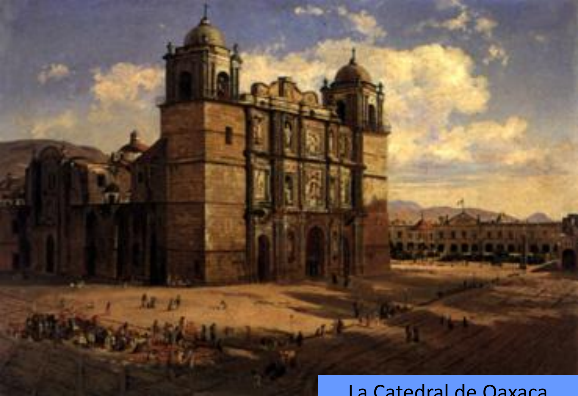
La Catedral de Oaxaca José María Velasco