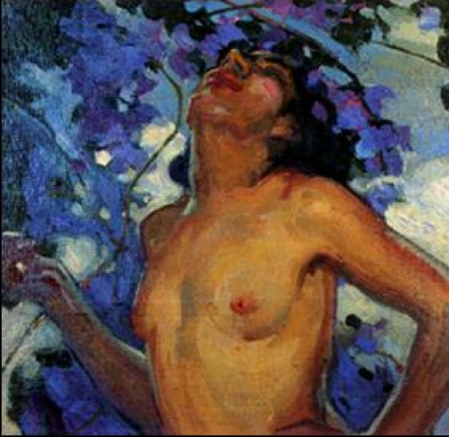
Bugambilias Saturnino Herrán