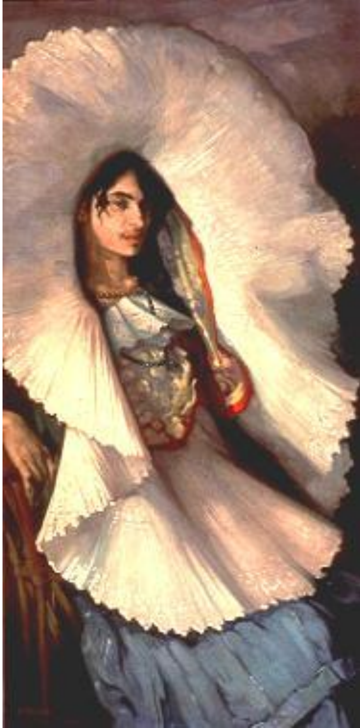
La Tehuana Saturnino Herrán