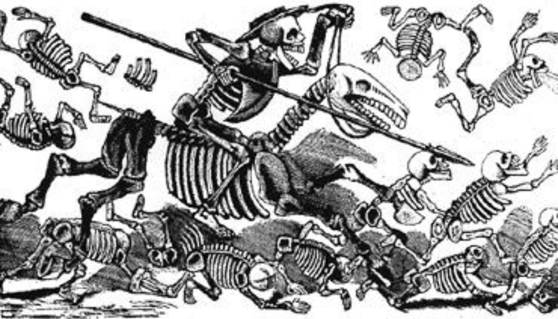
Calavera Don Quijote José Guadalupe Posada