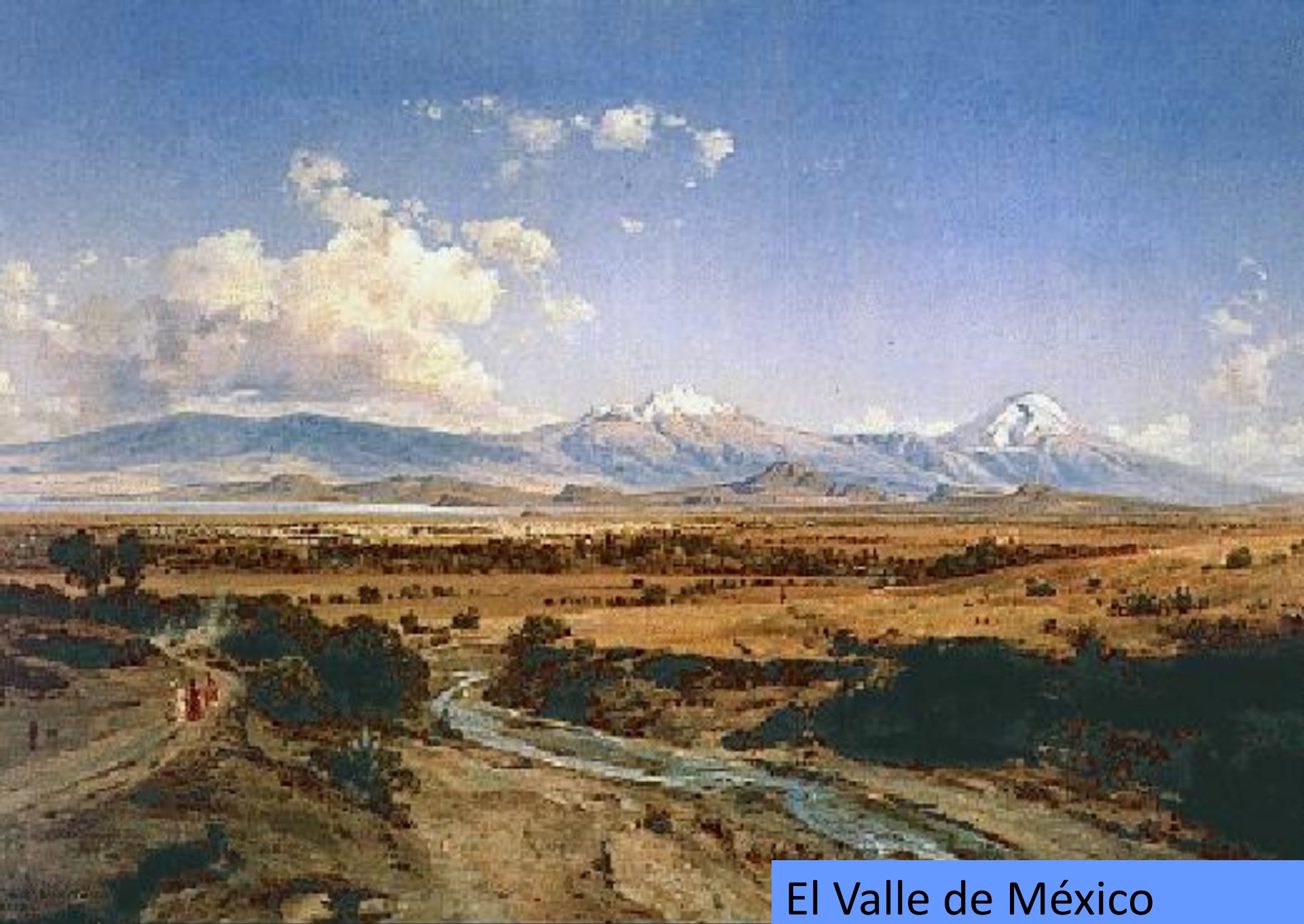
El Valle de México José María Velasco