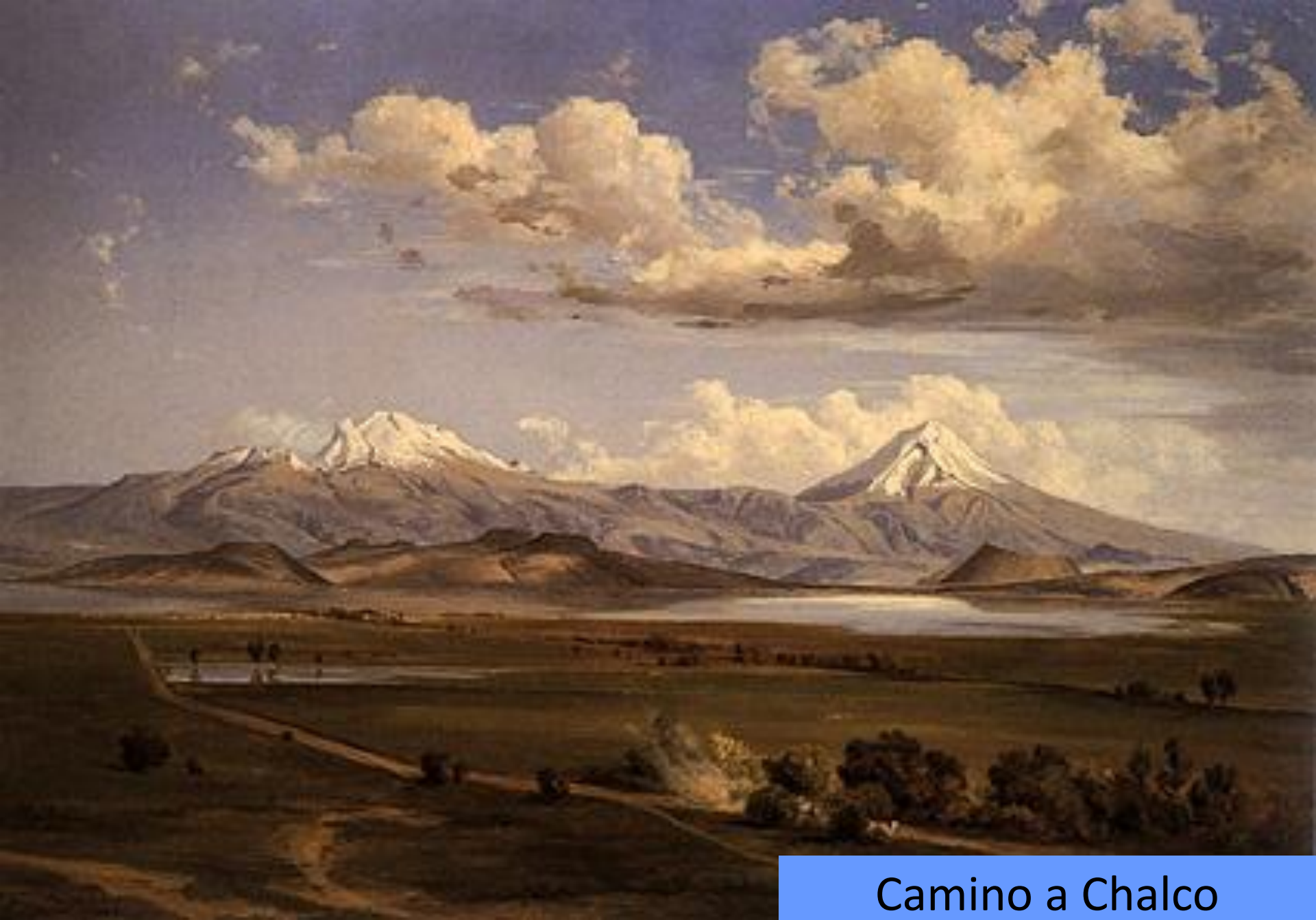
Camino a Chalco José María Velasco