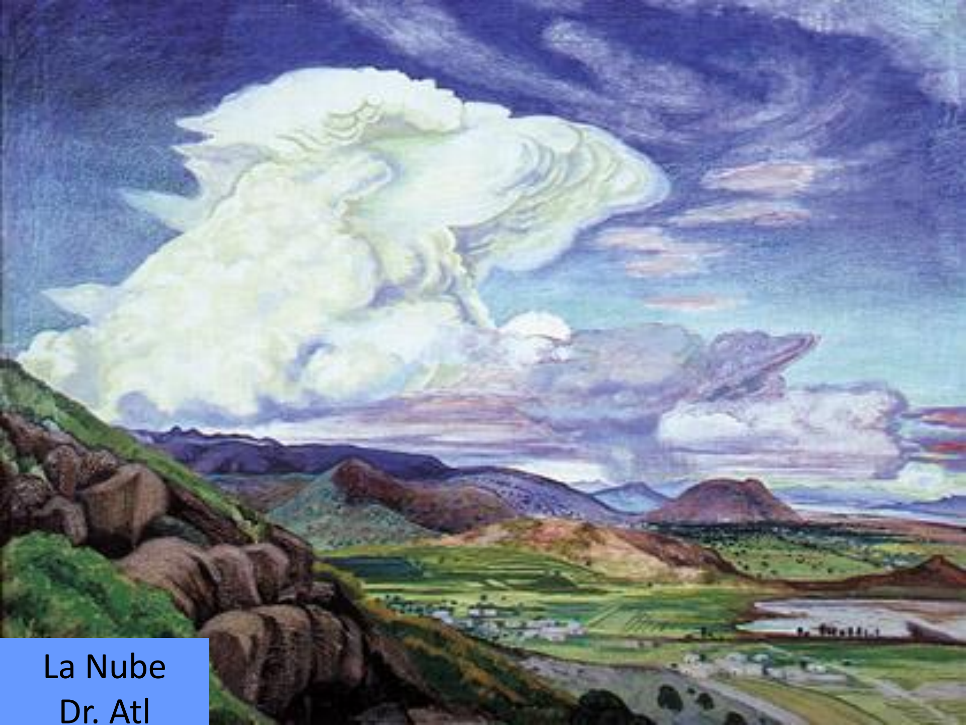
La Nube Dr. Atl