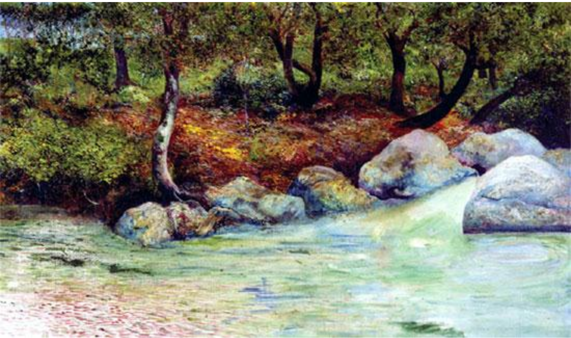
Paisaje con bosque y río Joaquín Clausell