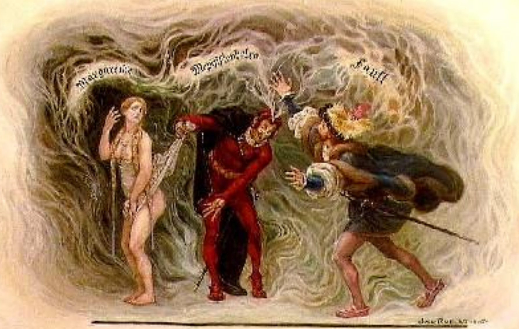
Fausto, Mefistófeles y Margarita Julio Ruelas