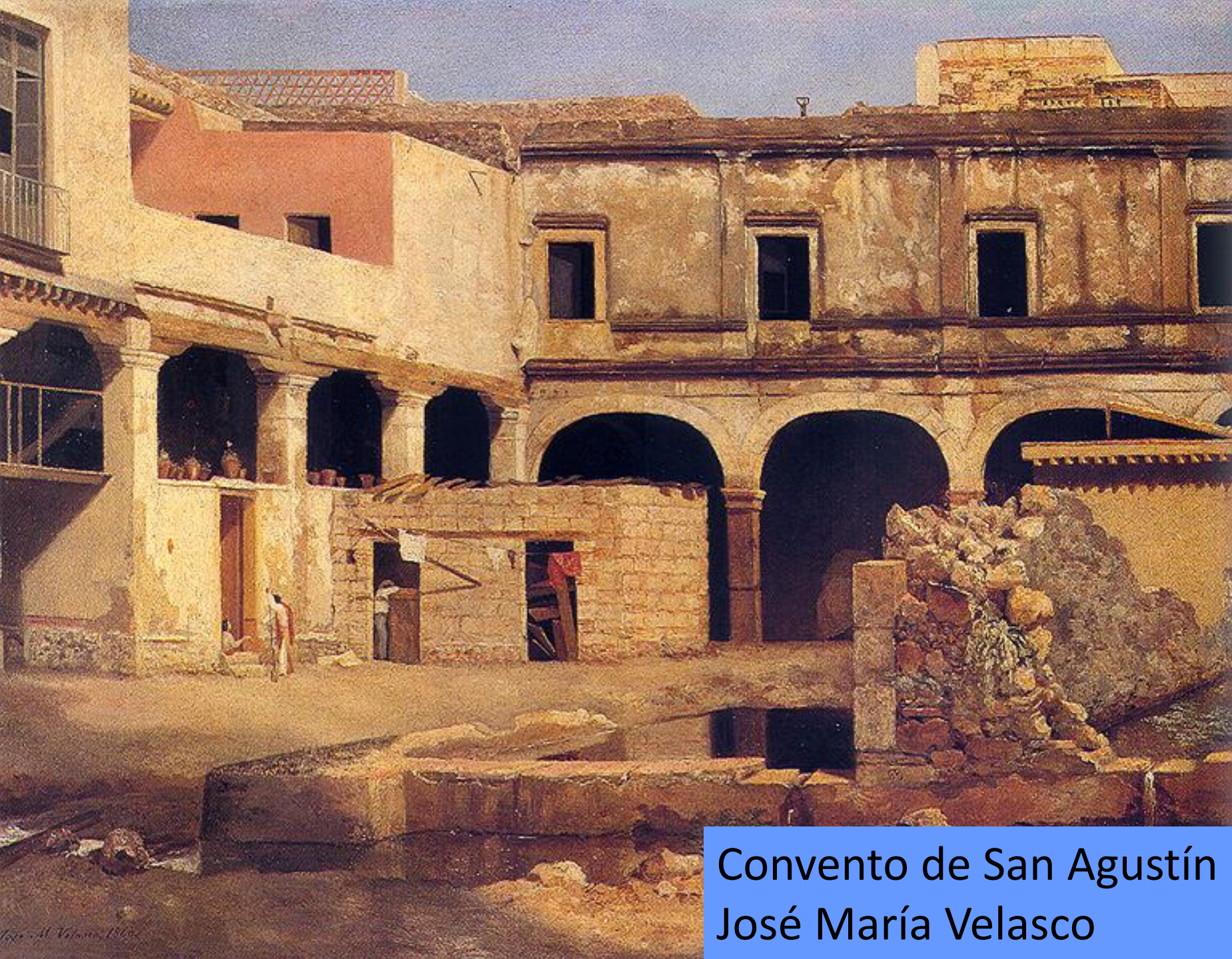
Convento de San Agustín José María Velasco