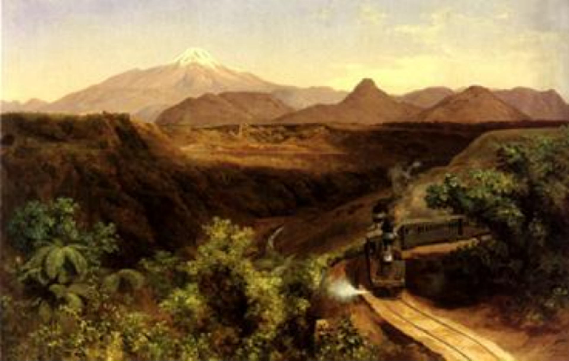
Citlaltepeli José María Velasco