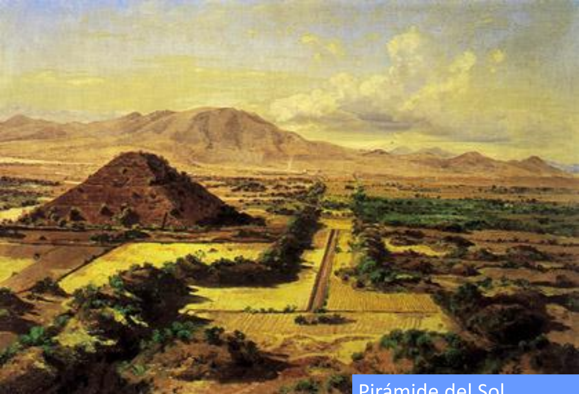
Pirámide del Sol José María Velasco