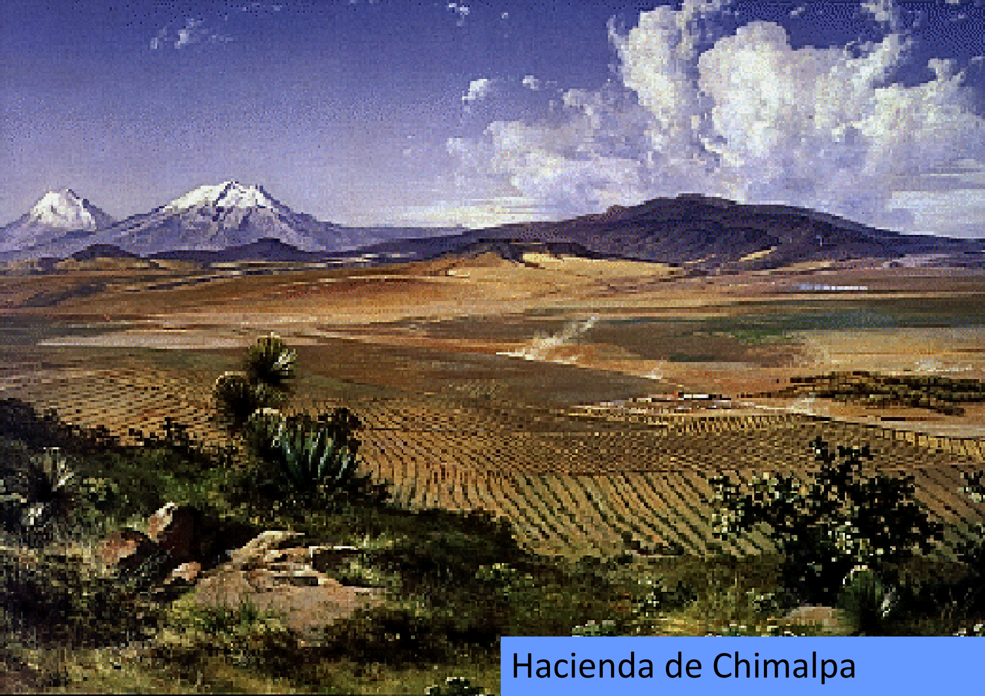
Hacienda de Chimalpa José María Velasco