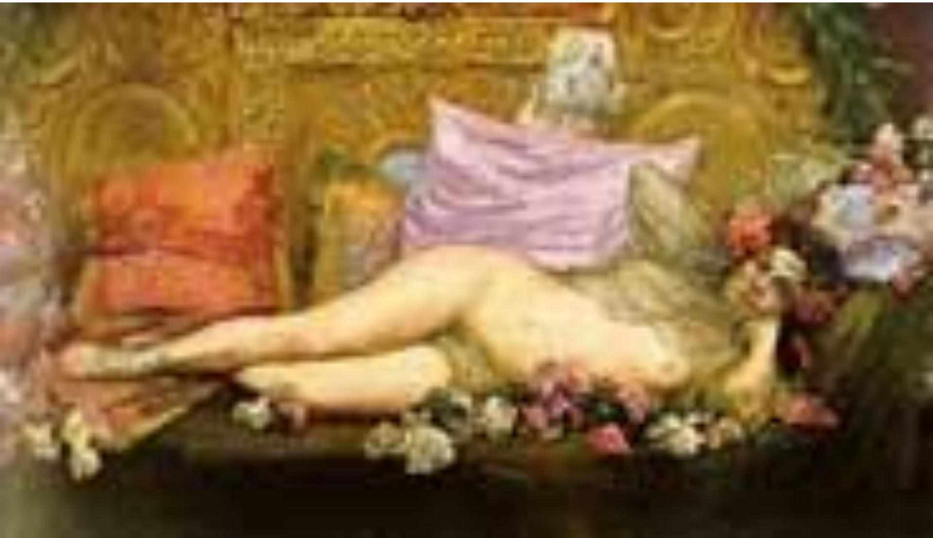
Desnudo barroco Germán Gedovius