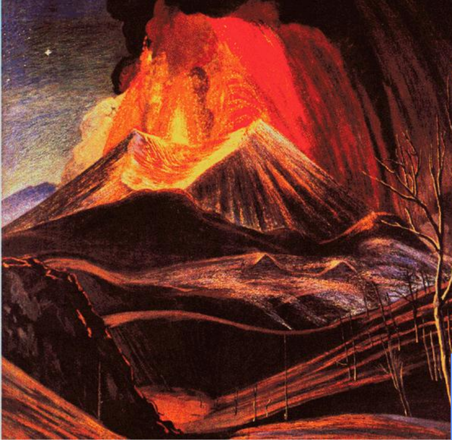
Erupción del Paricutín Dr. Atl