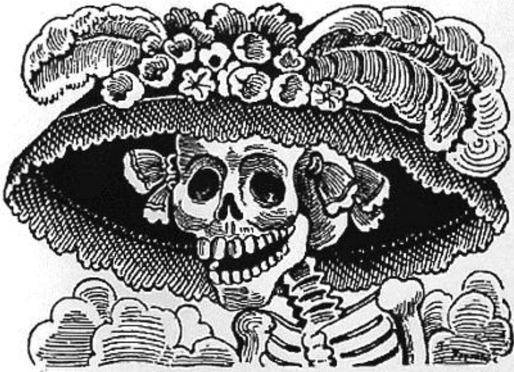
Calavera Catrina - José Guadalupe Posada