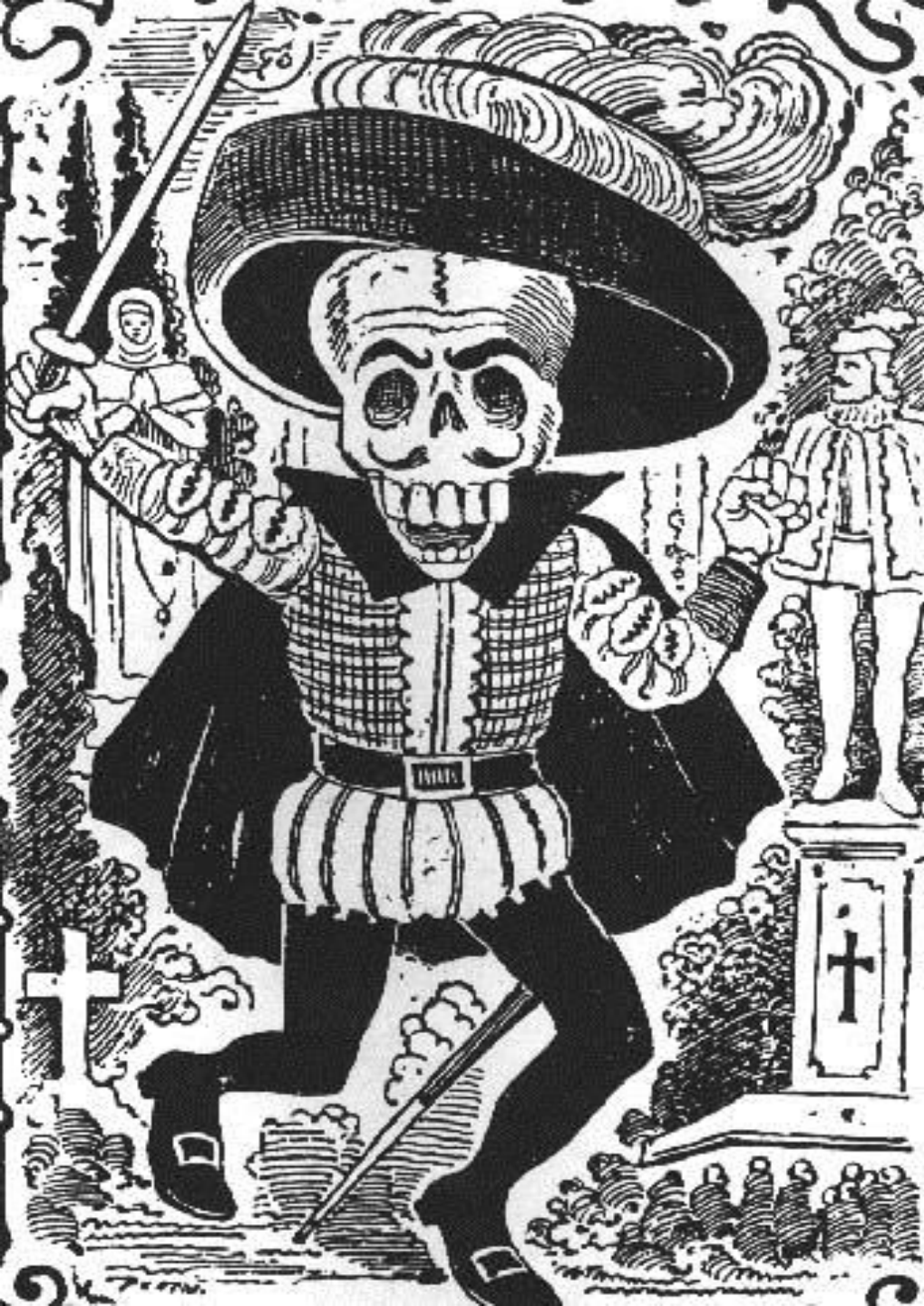
Calavera Don Juan Tenorio José Guadalupe Posada