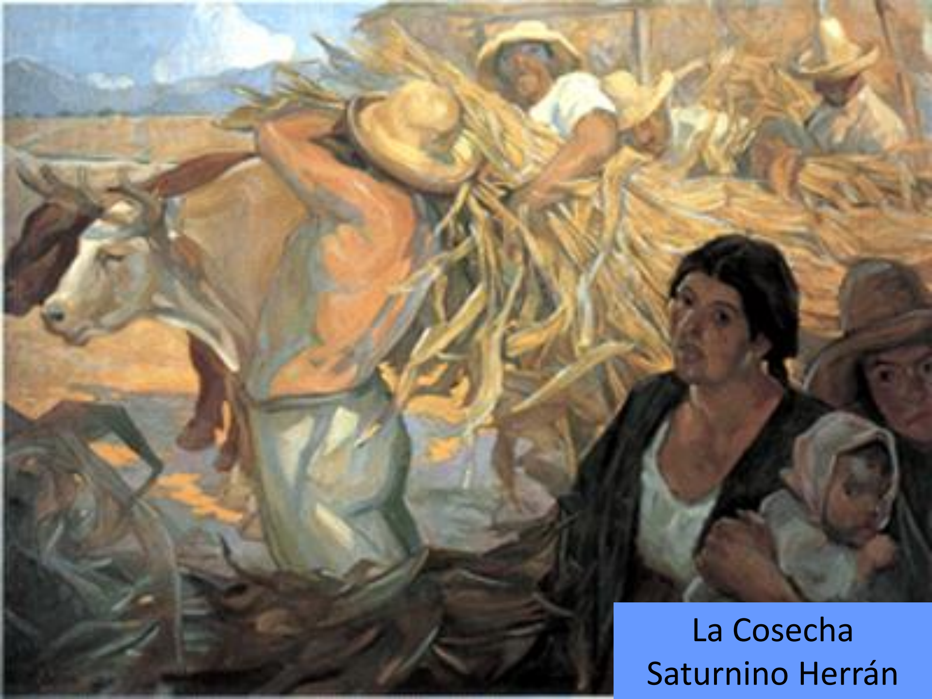
La Cosecha Saturnino Herrán