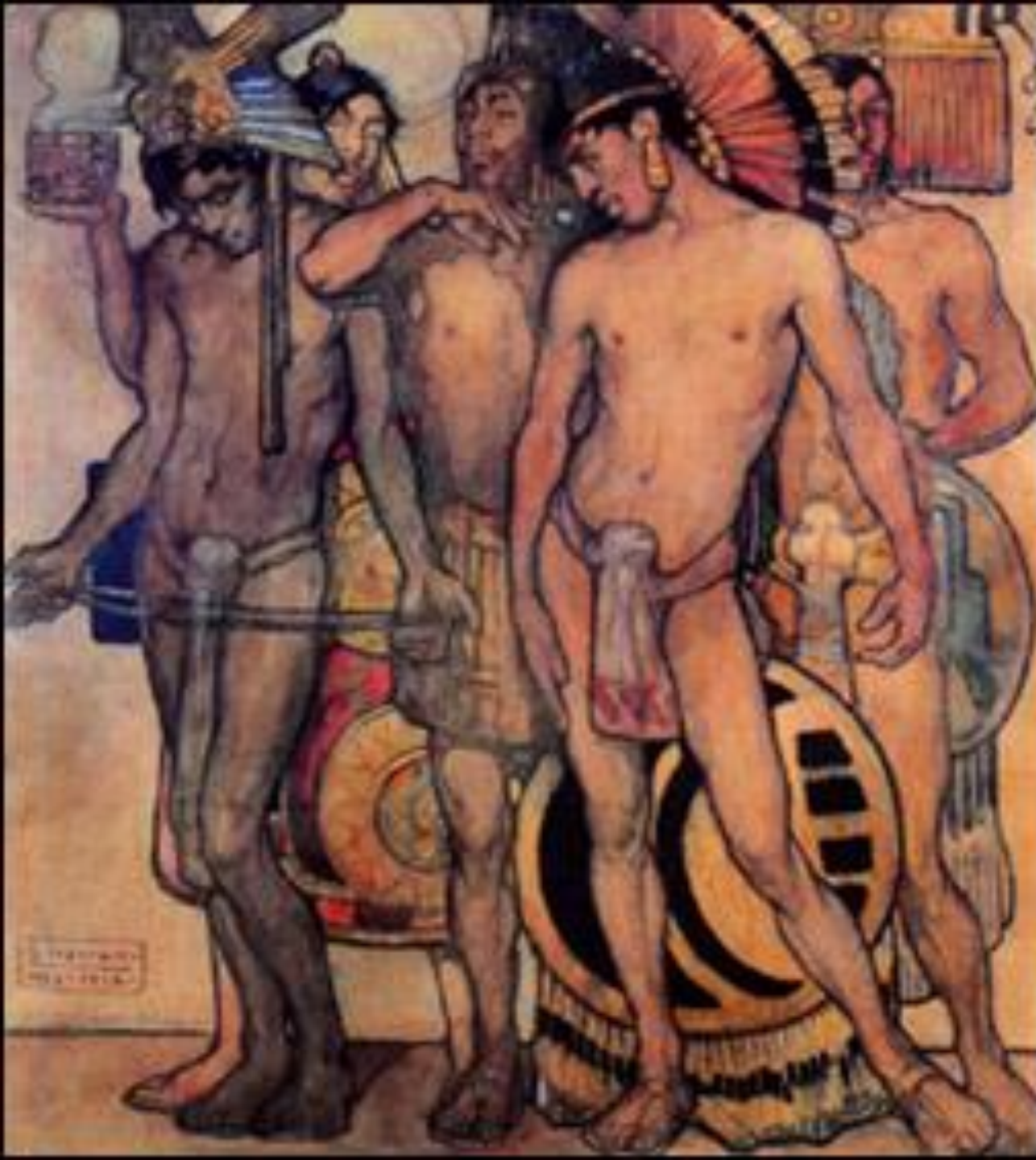
Panel Decorativo “El hombre antiguo” Saturnino Herrán