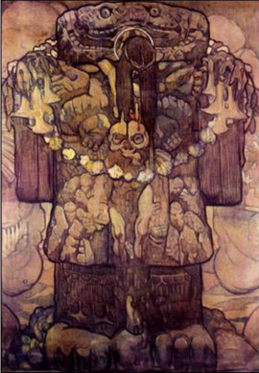
Coatlicue Saturnino Herrán